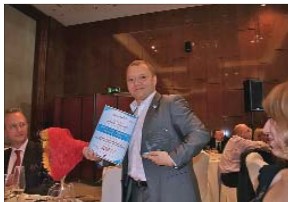
Награда за самый инновационный стенд