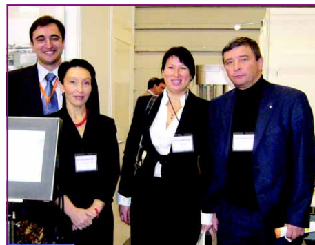
На стенде «Ойстар»

Постоянно обновляющийся зарубежный рынок фармоборудования, где происходят слияния, поглощения, продажи и покупки компаний, как в зеркале, отразился и на структуре выставленных на «Фармтехе-2008» крупных российских дистрибьюторов, имеющих на выставке самые большие стенды, которых хорошо знают российские заказчики.