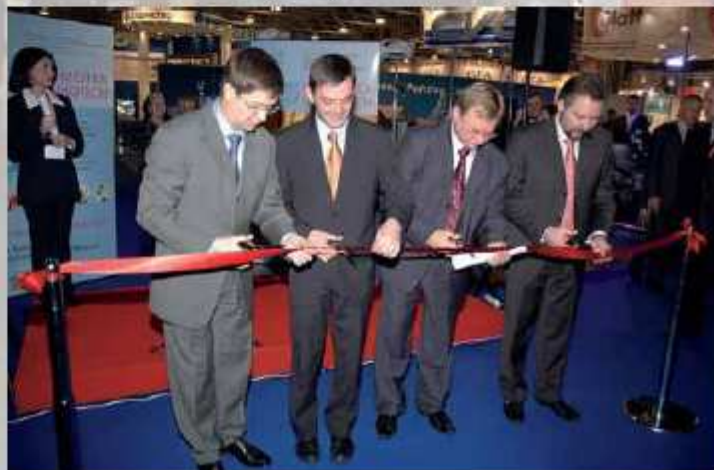
Еще мгновение, и выставка открыта